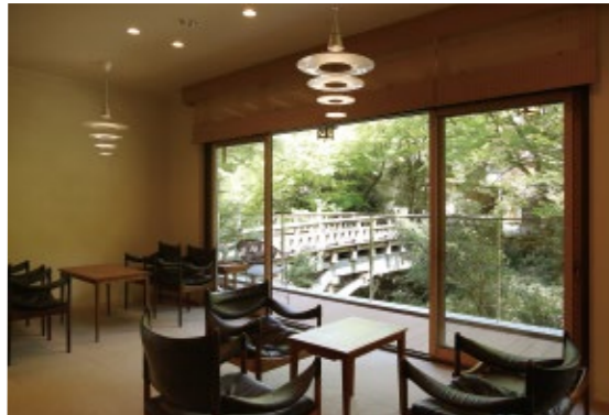
こおろぎ橋と鶴仙溪。ロビーからの風情ある眺め