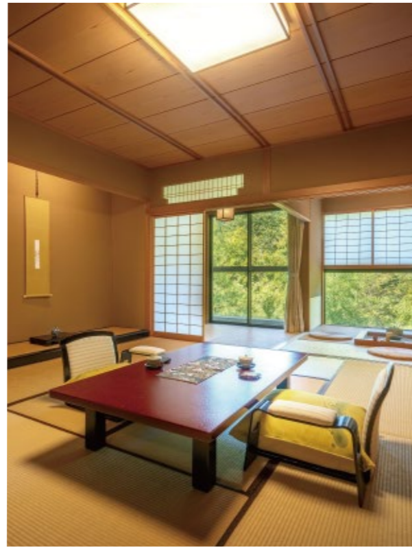
客室全てが竹林に面しており、笹のそよ音が快い