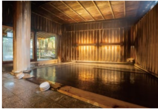
大浴場「瑠璃光」はヒノキとヒバの香りが