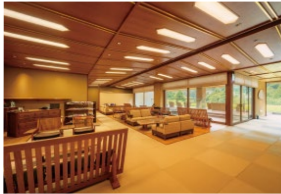
ロビーでは15時からフリードリンクのサービス