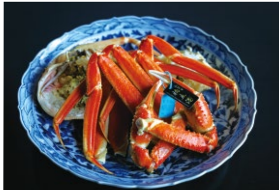
タグ付き活ズワイガニで北陸の冬の味覚を存分に