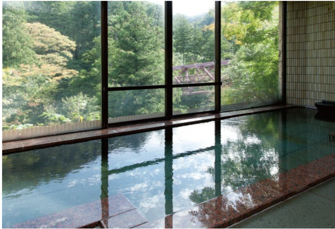
鶴仙溪を望む温泉「川かぜの湯」。露天風呂付きの「月かげの湯」と、22時に男女入れ替わり