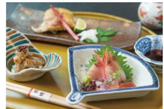
食事は部屋食。一品一品がタイミング良く給仕される