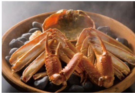
冬だけの地蟹懐石はすべてタグ付きの加能蟹