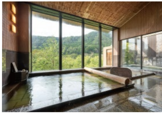
浴槽に横たわる丸太に身体を預けてのんびりと