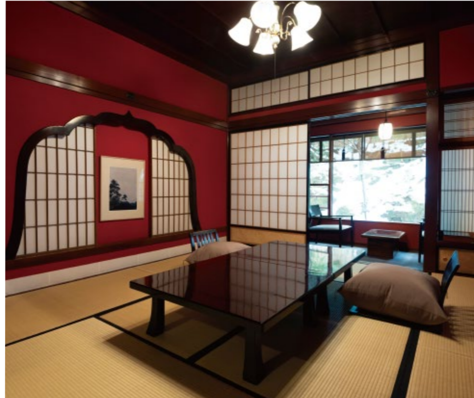
藩主ゆかりの特別室「御陣(おちん)」。魯山人も好んで逗留