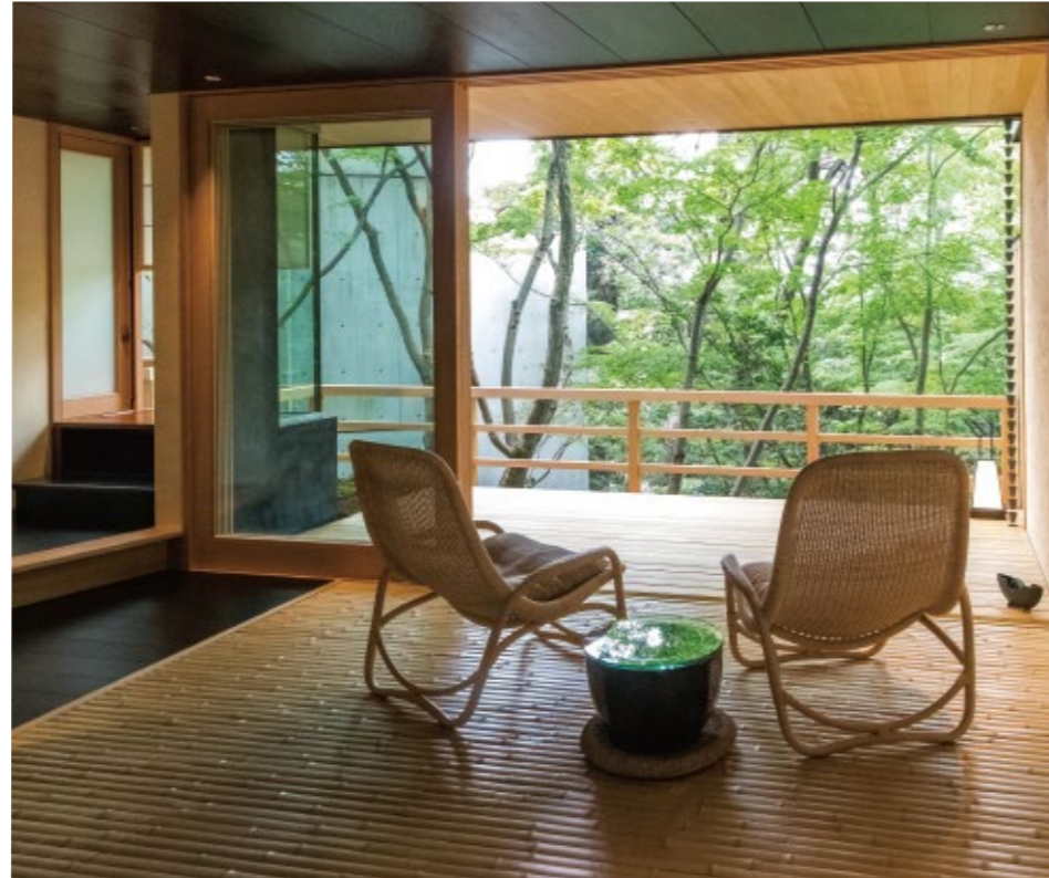
山庭の自然を間近に感じられる客室