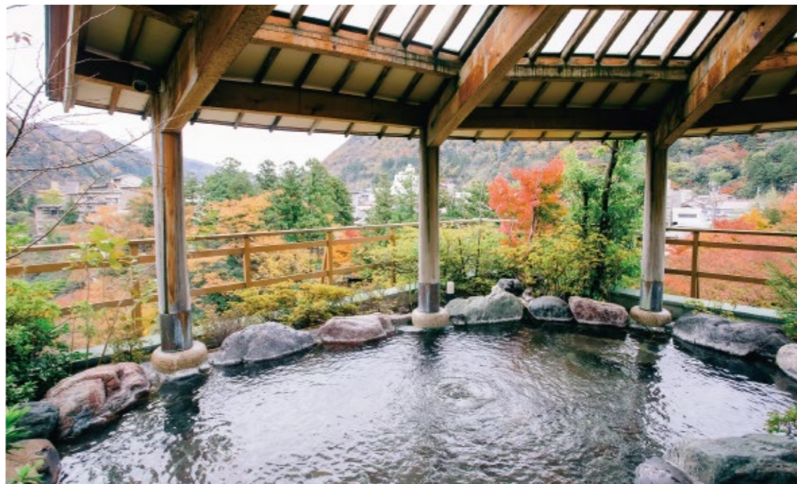
自然と一体感のある最上階の露天風呂。鶴仙溪に面した大浴場もある