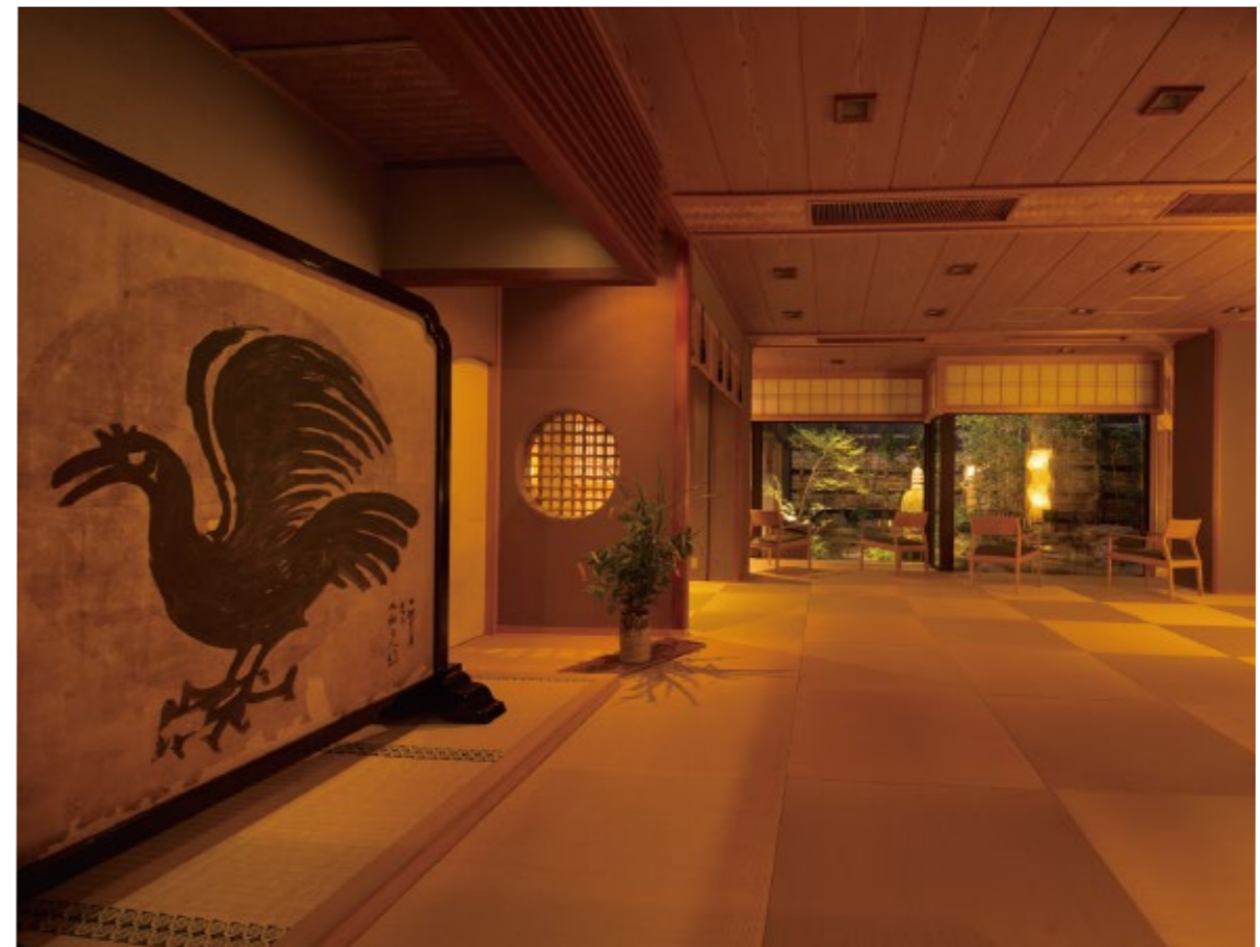
ロビーには北大路魯山人の手になる「暁鳥の衝立」が

内そこかしこに伝来の美術品や魯山人の作品が飾られて、建物にも庭園にも歴史に裏打ちされた風格が漂います。 一方で、高齢者や子どもにも優しい寝湯を備えた客室や、源泉のミストに包まれるサウナ感覚の浴場など、現代的な志向を取り入れてアップグレードされた設備も見逃せません。時代が変わっても変わらぬもてなしと、時代が合わせたもてなしの両方が息づく心地良さは時を重ねた同館ならではの魅力です。