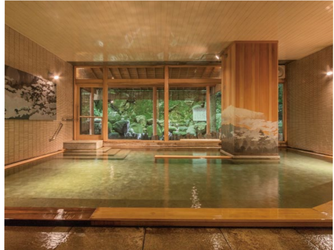
大浴場「原泉閣」はたっぷりの湯量。露天風呂では霧の演出も