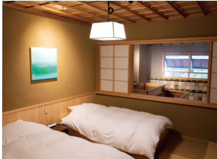
寝湯の付いた二層式湯船のある和洋室

美術館さながらの館内 設備充実で快適ステイ 山代温泉の湯元「湯の曲輪(ゆのがわ)」で、一日約10万リットルという山代随一の湯量を誇る宿です。そして大聖寺藩の湯番頭(ゆばんがしら)として山代の湯を守り続けた同館は、現当主で18代目。江戸時代には歴代藩主、明治から大正は有栖川宮家や小松宮家などの皇族、北大路魯山人といった文人墨客に愛されました。ゆかりの客室には当時の面影が残り、館