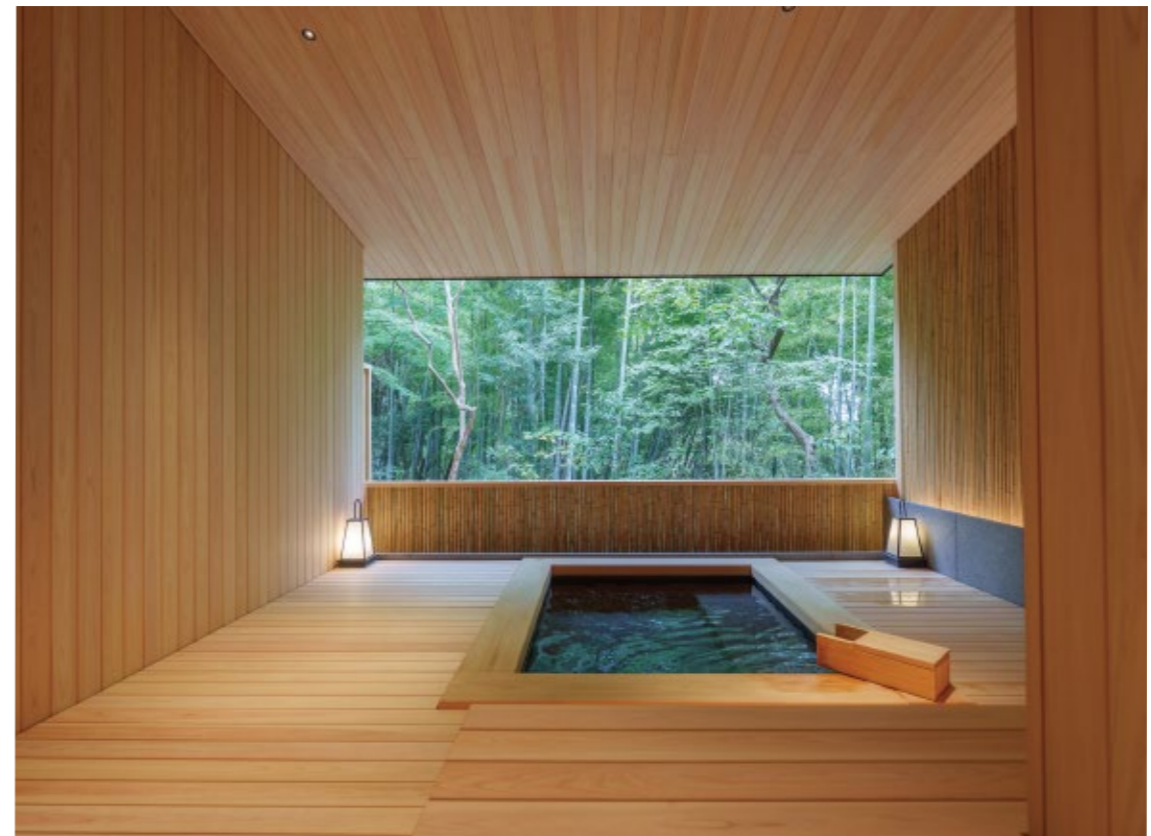
ヒノキ造りが清々しい浴場「薄香(うすこう)」。浴場は2つ。どちらも露天風呂とサウナ付き

快適。また温泉大浴場は瞑想したくなるような「玄青」とヒノキ造りの「薄香」の2つに「新」されました。より深いリラクゼーションには、スパ「円庭施術院」がおすすめです。中医師が監修した薬草の調合法を用い、一人一人の体調に合わせてトリートメント。心と身体のコリがゆつくりとほぐれていきます。 自然の静けさの中で自分と向き合う時間を持ちたい人に満足度が高い宿です。