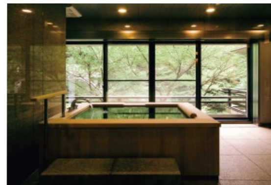
「ユニバーサルスイート」には広々とした浴室が

☎ 0761-78-0077 📍 加賀市山中温泉東町1-ホ-17-1 🍽️ 料 1泊2食付平日4万6000円～ 🕒 時 IN14時/OUT11時 🅅️ P 40台 【客室数】25室【露天付き客室】あり 【露天風呂】あり【貸切風呂】なし 【その他】貸し切りダイニング、 アートギャラリー、ライブラリー、茶房