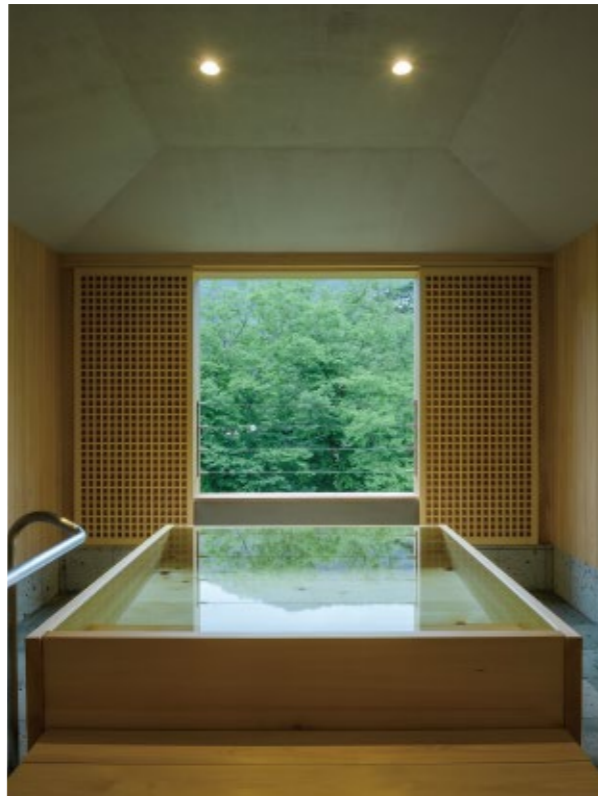
和洋室「紅葉の間」「あやとりの間」は半露天風呂付き