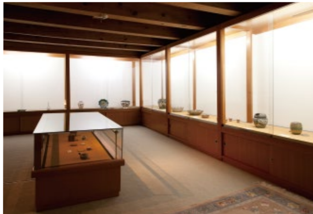
九谷焼ギャラリー「蔵」。貴重な古九谷などを常設展示