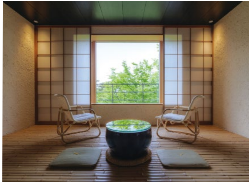
和室続きの広縁は足裏が気持ち良い竹敷き

洗練の客室や大浴場 スパでトリートメントも 「からっぽの豊かさ」をテーマに、心身ともに癒される空間と時間を提供してくれると評判の宿です。竹や珪藻土など和の素材を現代的に再構築し、余分なものこそぎおとした客室など全室が山庭に面し、自然とリンクするような造りに心が洗われます。令和5年には創業95周年を機としたリニューアルが完了。全室に床暖房を備えており冬も