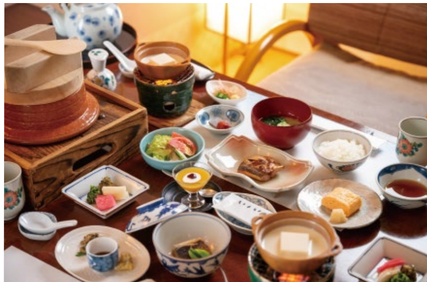
朝食には陶器窯を使った炊き立てご飯が