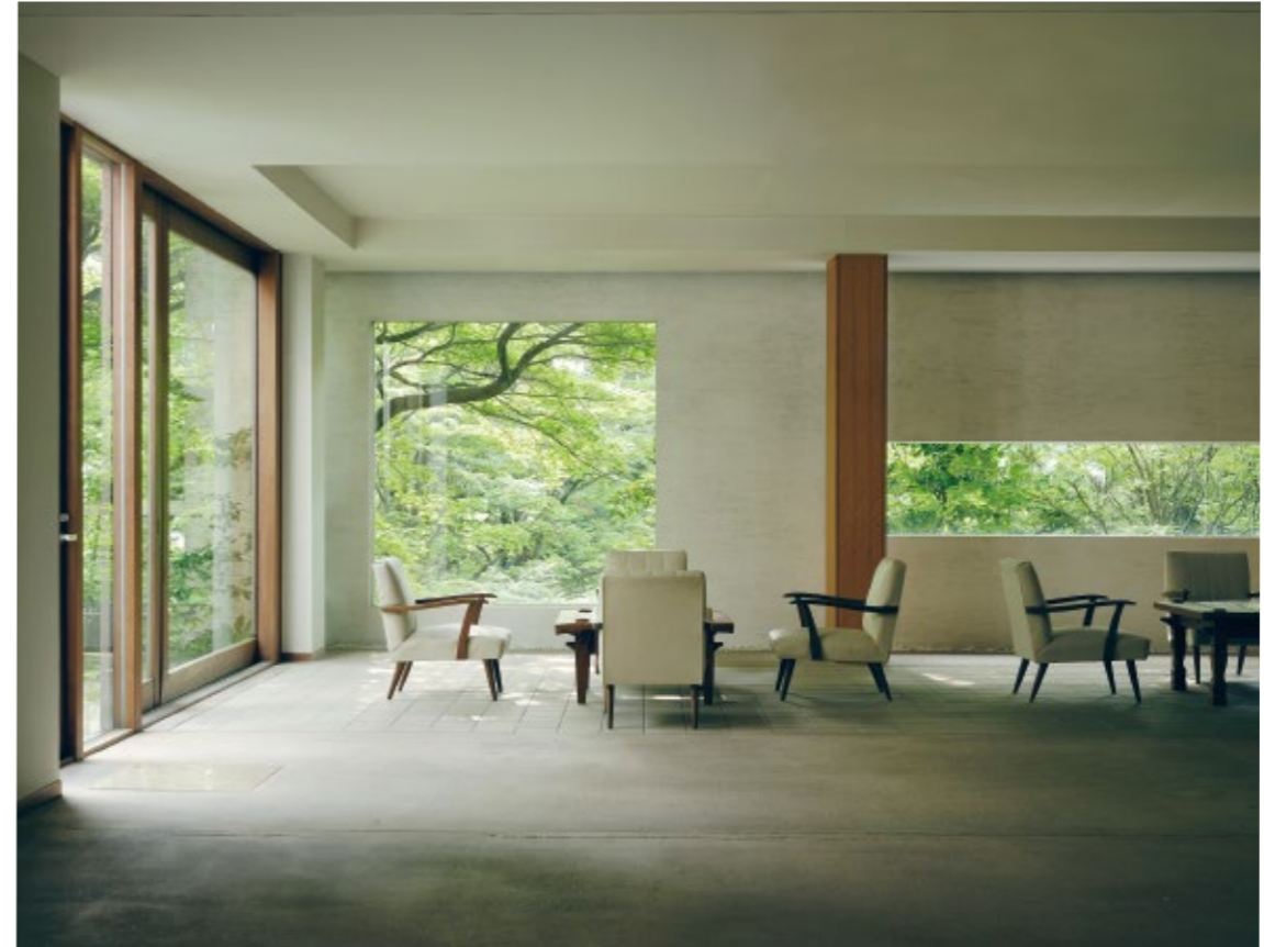
エントランスは珪藻土を使った土間造り。そのまま山庭へと足を運びたいくなる