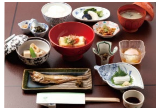
朝食の一例。ゴリの佃煮やハタハタなど地元の味が並ぶ