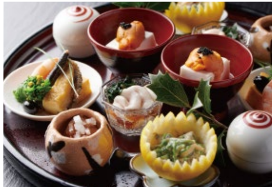
日本海の幸や加賀野菜ふんだんな季節の懐石料理