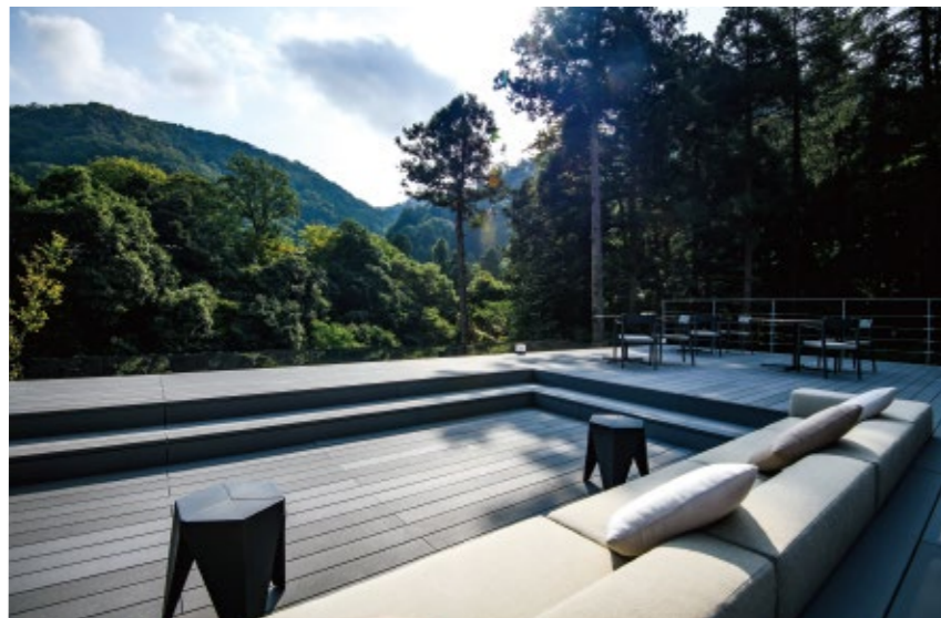
山中の自然に癒される屋上テラス。4～11月にオープン