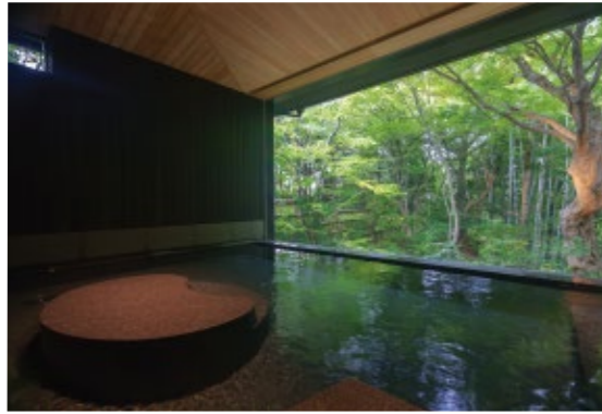
湯の中に背もたれがある浴場「玄青(げんせい)」