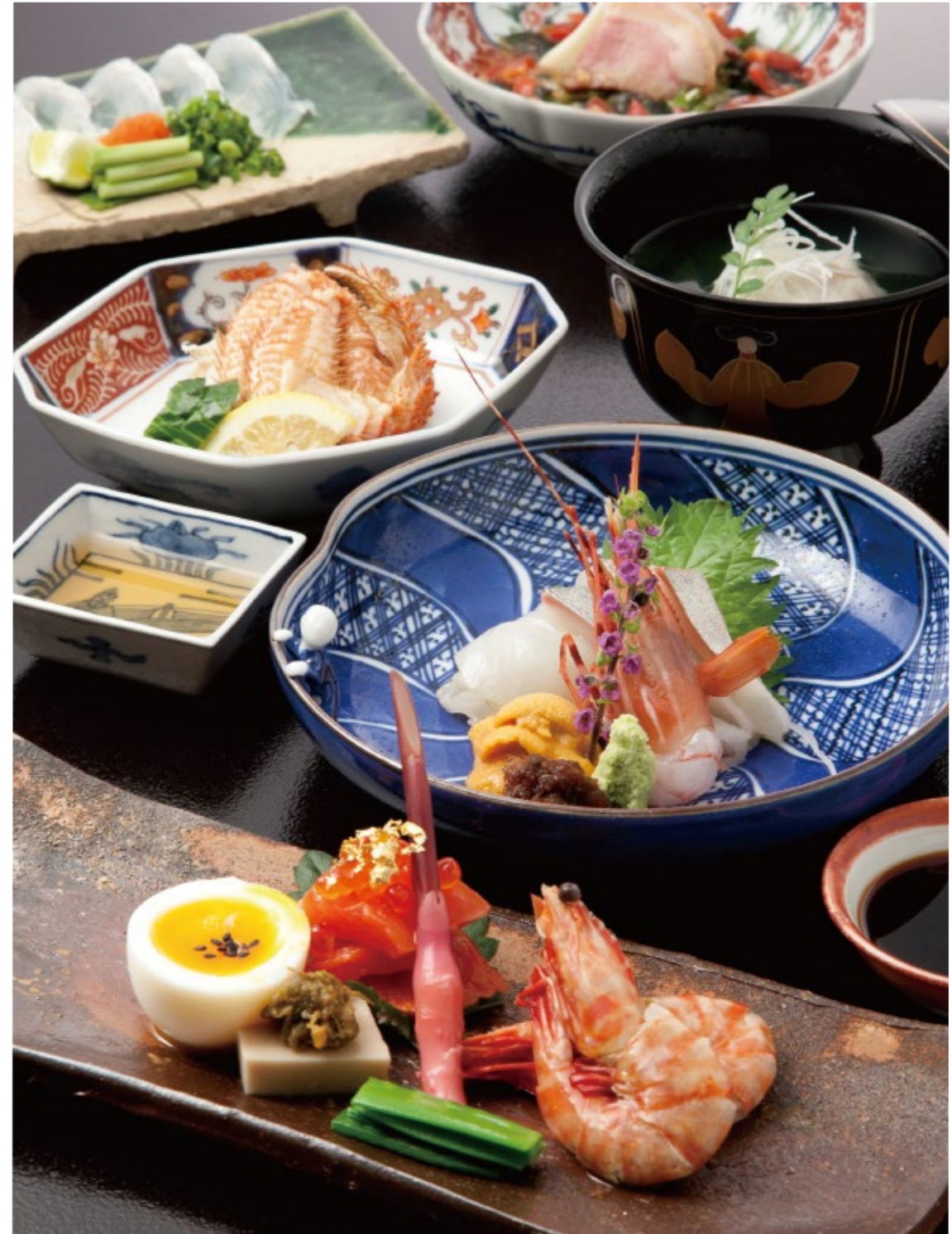
器は九谷焼や山中塗を多用。伝統工芸の里、加賀ならではのもてなし