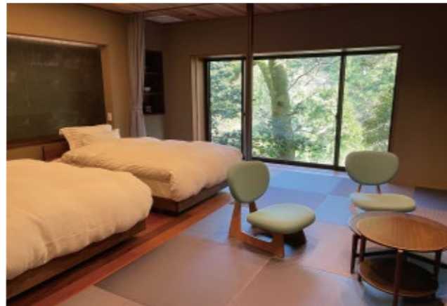
露天風呂付き客室「岩船」。和モダンなデザイナーズスイート